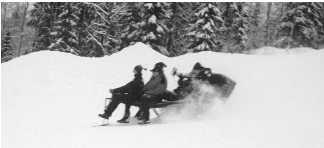
Mikä menee ylös, tulee myös alas.