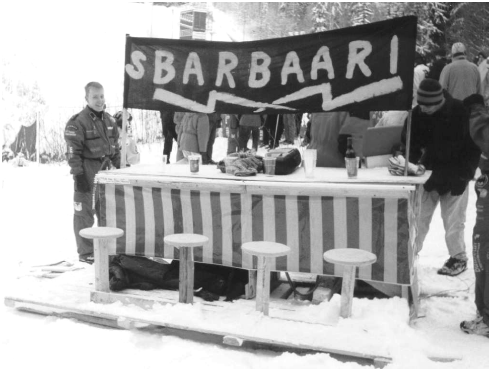
Skillan härveli oli aika hieno.