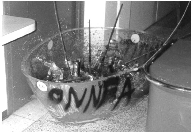
Emmehän unohda onnentoivotuksia?

Välien parantamiseksi päätimme palauttaa ainakin pullo - sisällön kanssa taisi olla jo myöhäistä.