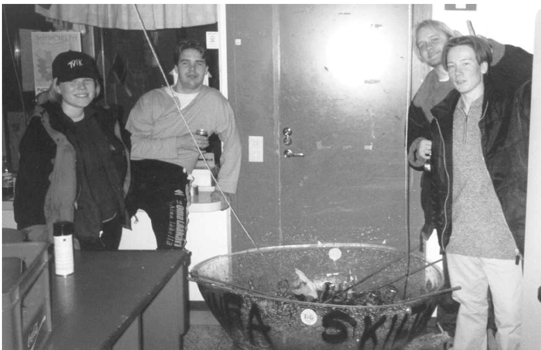
Iskuryhmä oli tässä vaiheessa väsynyt, mutta onnellinen.