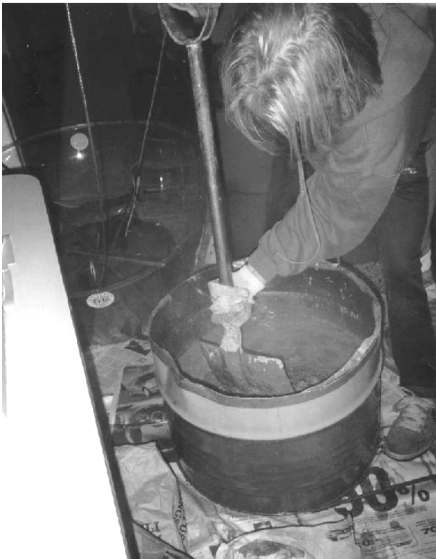
Likaista työtä... mutta vaivan arvoista.

Skilta on kasvanut ison (ja raskaan) miehen ikään, ja tarvitsee siis ison (ja raskaan) vuosijuhlahahjan. Betoni oli luonnollinen valinta.