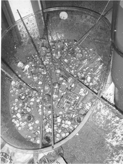
30 colapulloa. TiTe palauttaa aina lainaamansa esineet. (Se 31. pullo annettiin itse juhlatilaisuudessa.)

Alkuvuodesta TiTe päätti paikata limsan hinnannoususta kärsinyttä talouttaan vaihtamalla tilapäisesti tukkuria. Uudeksi tukkuriksi valittu Skilta ei kuitenkaan osannut arvioida valtavaa menekkiä oikein, ja TiTe saikin hieman kuittia suurista eristään.